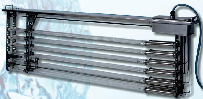
BALASTROS ELECTRÓNICOS SUBMERSÍVEIS AUTO-ARREFECIDOS